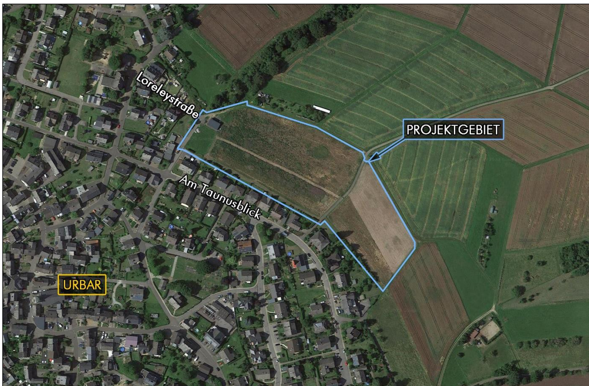
Abb. 1: Lage des Projektgebietes (hellblau markiert) mit hinterlegtem aktuellem Luftbild.

Gegenstand der Luftbild- und Aktenauswertung ist ein ca. 2,5 ha großes Areal im Nordosten von Urbar im Rhein-Hunsrück-Kreis (vgl. Abb. 1).