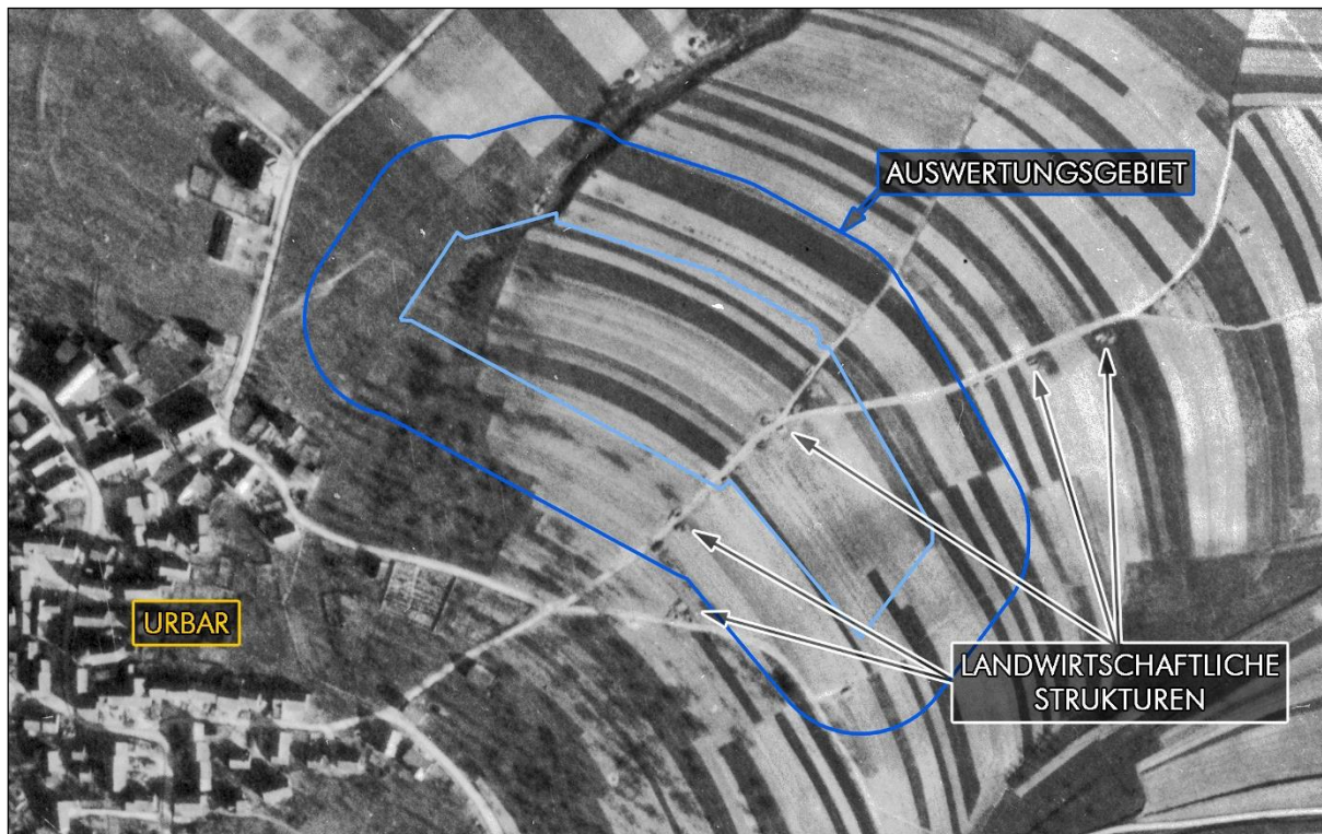
Abb. 3: Das Projektgebiet (hellblau markiert) mit dem um 50 m gepufferten Auswertungsgebiet (dunkelblau) am 22.03.1945 (Flug-Nr. 31-4540, #2043, Ausgangsmaßstab ca. 1 : 10.000).

Die Lage des Projektgebietes (vgl. Abb. 1-3, hellblaue Markierung) wurde näherungsweise auf die historischen Luftbilder übertragen und mit einem Sicherheitspuffer von 50 m versehen (vgl. Abb. 3, dunkelblaue Markierung).